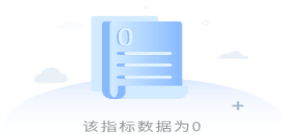
图 3-10 科技报告发文趋势图