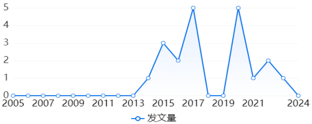
图 3-4 核心论文发文趋势图