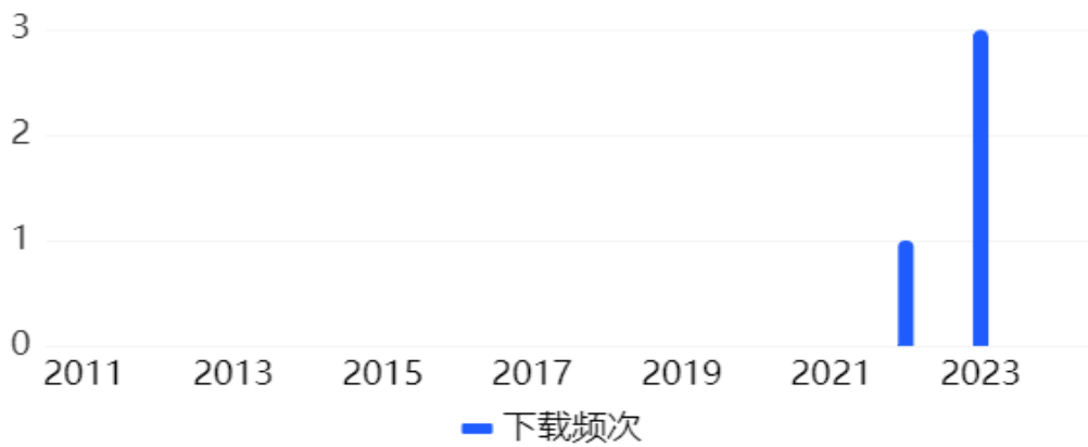
图 5 - 4 会议论文下载趋势图