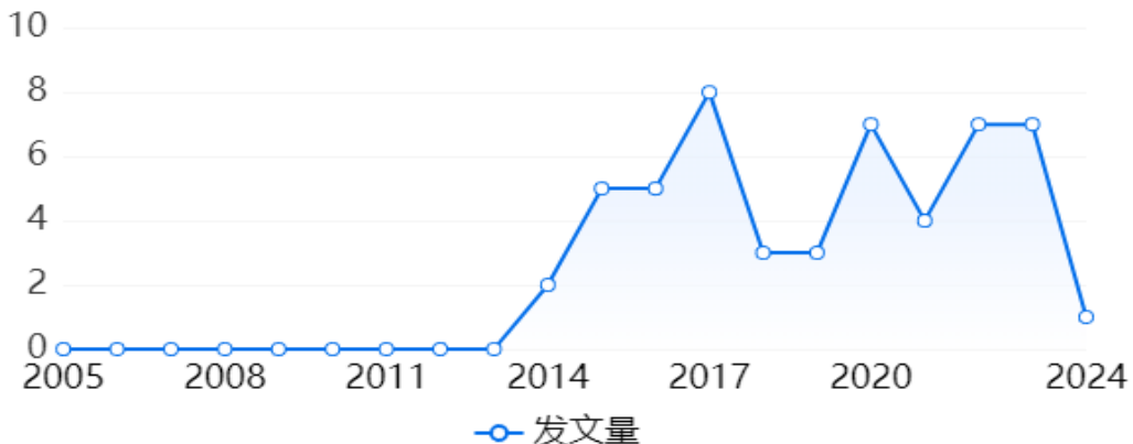
图 3-2 至图 3-10 以趋势图的形式，更直观地展示了该主题领域下不同文献资源发文量的逐年变化趋势。其中，期刊论文、学位论文、会议论文等学术论文的发文趋势，反映了该主题领域的学术研究热度趋势；核心论文的发文趋势，反映了该主题领域高质量期刊论文的发表趋势；基金论文的发文趋势，反映了一段时间内国家对该主题领域的资助趋势；专利的申请趋势，反映了该主题领域的科研技术创新趋势；科技成果的发文趋势，反映了该主题领域实用性科研开发成果的数量变化趋势；科技报告的发文趋势，反映了国家在该主题领域科技实力的变化趋势。