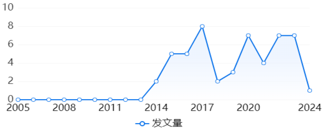
图 3-3 期刊论文发文趋势图