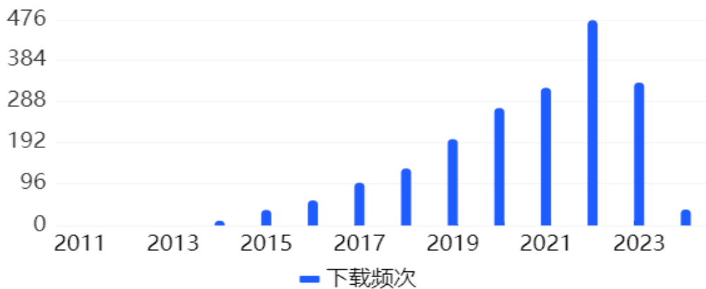
图 5 - 1 学术论文下载趋势图

图 5-1 至图 5-5 以趋势图的形式，更直观地展示了该主题领域下不同文献资源下载频次的逐年变化趋势。其中，期刊论文、学位论文、会议论文等学术论文的下载趋势，反映了该主题领域的学术关注度趋势；专利的下载趋势，反映了该主题领域技术创新情况的被关注趋势。