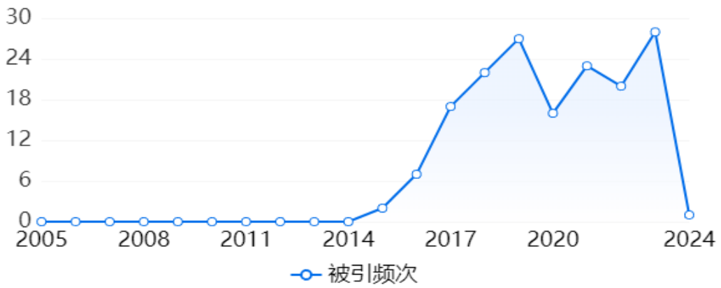
图 4-2 期刊论文被引趋势图