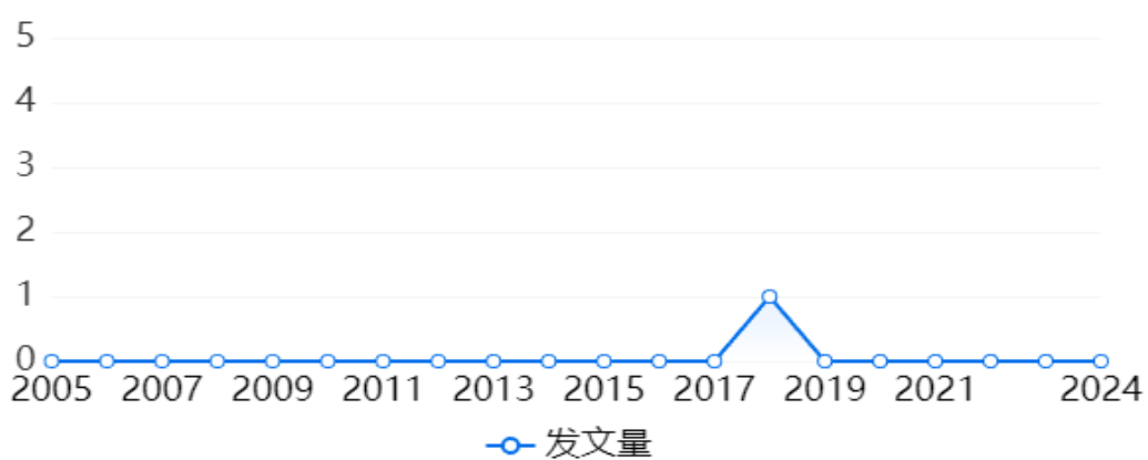
图 3 - 7 会议论文发文趋势图