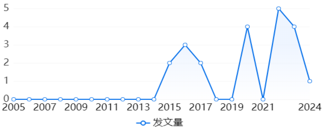
图 3-5 基金论文发文趋势图