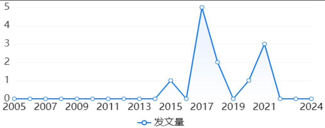
图 3-9 科技成果发文趋势图